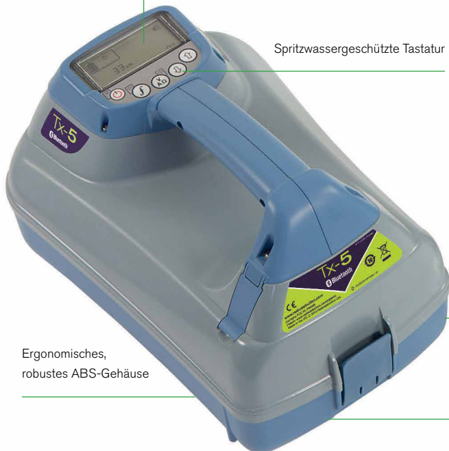
Ergonomisches, robustes ABS-Gehäuse

Betrieben mit 8 x NiMH- oder Alkali-LR20-Batterien (D-Zelle) oder optionaler Akkuversion